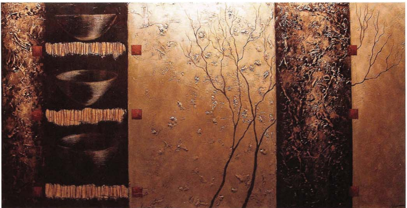
Histoire naturelle II , Technique Mixte, 76 x 152 cm

Sa démarche s'appuie sur la dualité, celle de la ligne et de la masse, du passé et du présent, du geste libre et du geste maîtrisé. Surtout, peut-être, celle du traitement où elle juxtapose une facture très tactile pour ses fonds. Une « écriture » sensible, voire épidermique par son registre de nuances et de textures. C'est là d'ailleurs que son approche intuitive se développe avec