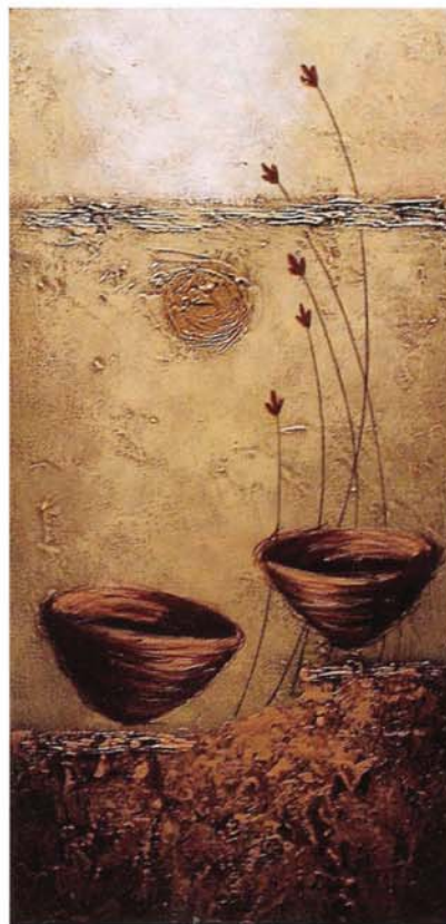
Sans titre, Technique Mixte, 61 x 31